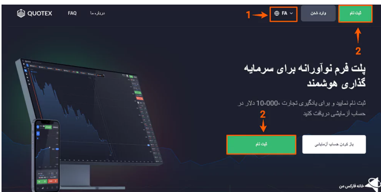
ورود به سایت اصلی جهت ثبت نام بروکر کوتکس

2- با کلیک روی گزینه «ثبت نام» در بالای سایت (یا در وسط صفحه)، به بخش افتتاح حساب هدایت خواهید شد.