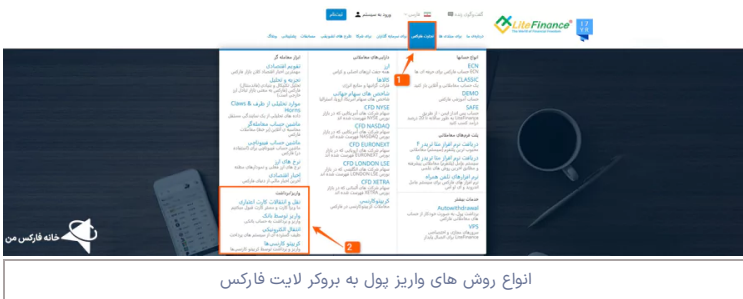
انواع روش های واریز پول به بروکر لایت فارکس

واریز و برداشت با ارزهای دیجیتال ایبیت کوین ، اتریوم ، تتر ، لایت کوین و ... در حال حاضر در معتبرترین بروکرهای فارکس ایران مانند بروکر آلیاری و همچنین بروکر آمارکتس قابل انجام می باشد. برای آشنایی با روش های واریز پول، وارد سایت لایت فارکس شده، و در منوی "تجارت فارکس" روی گزینه "واریز و برداشت" کلیک کنید.